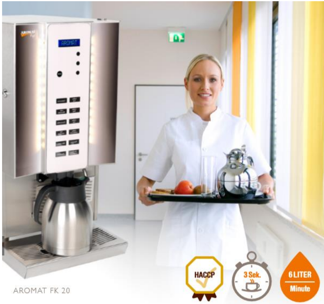
AROMAT FK 20